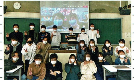
千葉商科大学小口ゼミの授業にZoomにて参加