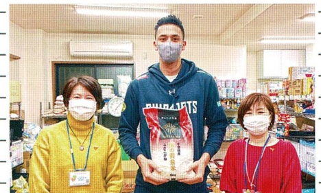
千葉ジェッツふなばしより米60kg寄付