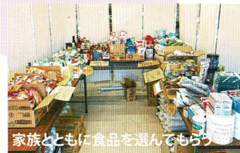
家族とともに食品を選んでもらう