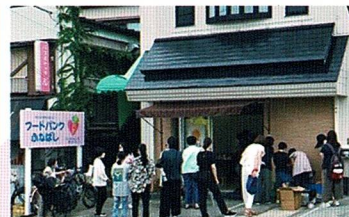
金杉の事務所で毎月「パントリーピックアップ」を実施